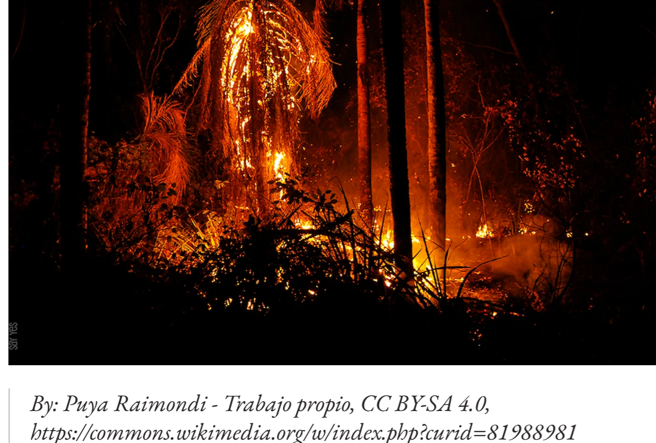
By: Pheya Rainondi - Trabajo propio, CC BY-SA 4.0, https://commons.wikimedia.org/w/index.php?curid=81988981

Estas personas, familias, comunidades son vulnerables a esta amenaza y la afectación que tiene en sus medios de vida, y es que difícilmente cuentan con las herramientas, o capacidades suficientes para poner alto a la emergencia que empezó con una chispa en un bosque seco. Un ejemplo claro es el incendio que se dio el año 2019, fue tan fuerte que se llegó a sentir el humo en la misma ciudad de Santa Cruz, tal fue la magnitud que superó los 5 millones de hectáreas quemadas y que este año ha arrasado con más de 150 mil hectáreas registradas en solo 1 semana (France 24, 2021).